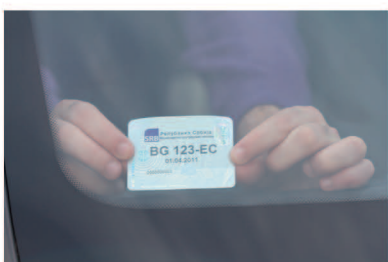
5 ПОЗИЦИОНИРАЊЕ НА ДОЊИ ДЕСНИ ДЕО ВЕТРОБРАНскоГ СТАКЛА