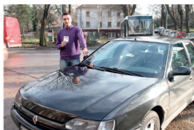
4 ПОЗИЦИОНИРАЊЕ НА ДОЊИ ДЕСНИ ДЕО ВЕТРОБРАНскоГ СТАКЛА