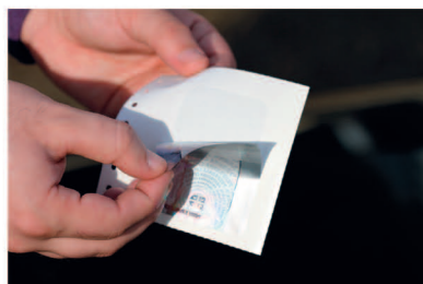
2 СКИДАЊЕ НАЛЕПНИЦЕ СА НОСАЧА НАЛЕПНИЦЕ