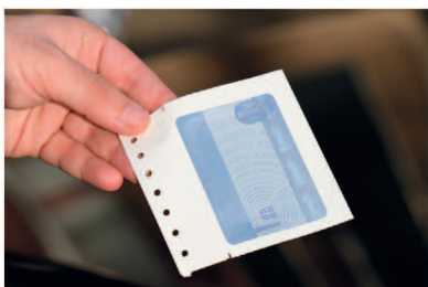
1 ИЗГЛЕД УРУЧЕНЕ НАЛЕПНИЦЕ