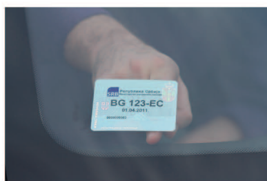
6 ПРЕЂИ ПРСТОМ ПРЕКО ЗАЛЕПЉЕНЕ НАЛЕПНИЦЕ