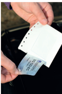
3 СКИДАЊЕ НАЛЕПНИЦЕ СА НОСАЧА НАЛЕПНИЦЕ